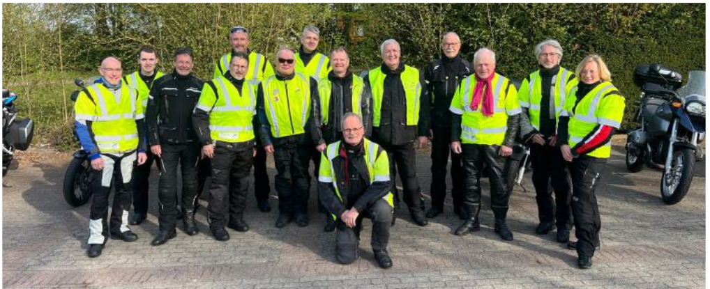
Teilnehmer der ersten Ausfahrt 2026

Dies hielt uns aber nicht davon ab, wie gewohnt auf dem Rückweg einen Stopp in einem gemütlichen Hofcafé einzulegen. Die Wahl fiel auf das Antik-Café in Labenz. Bei leckerer Torte und einer guten Tasse Kaffee ließ sich die erste gemeinsame Tour der neuen Motorradsaison nicht besser beenden.