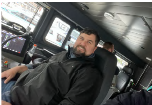
An Bord der WS 2

Ein besonderer Programmpunkt war in diesem Rahmen der Besuch des neuen Bootes der Wasserschutzpolizei, „WS2 Bürgermeister Nevermann“. Das moderne Patrouillenboot mit Plug-in-Hybridantrieb bietet elektrische Fahrzeiten von mindestens zwei Stun-