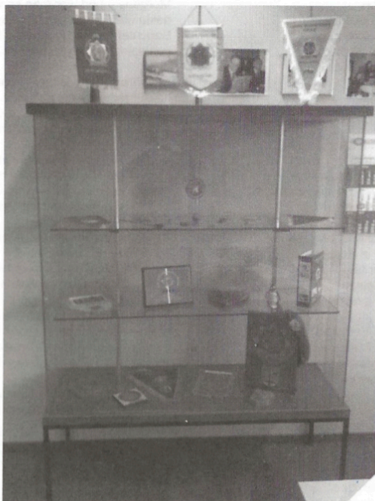
Vitrine im Dienstzimmer Landesgruppenleiters Mathias Reher

Für Fotobeiträge bedanke ich mich ganz herzlich bei: