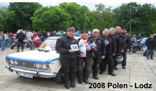
2008 Polen - Lodz

in Münster. 2004 fuhren wir dann schon über die deutschen Grenzen hinweg nach Dänemark oder zu einer Benefiztour nach Tschechien. In den folgenden Jahren folgten neben den Tagesfahrten wieder mehrtägige Touren in den kurvenreichen Harz, zur Edertalsperre, ins Sauerland, Erzgebirge, Polen, nach Franken, ins bergische Land oder auch nach Schweden. Überall trafen wir auf Gleichgesinnte und