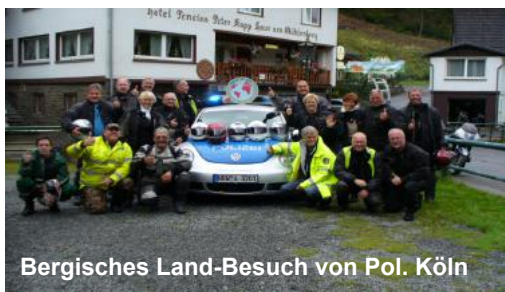
Bergisches Land-Besuch von Pol. Köln