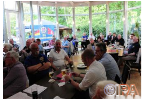
Ein Blick in die Versammlung